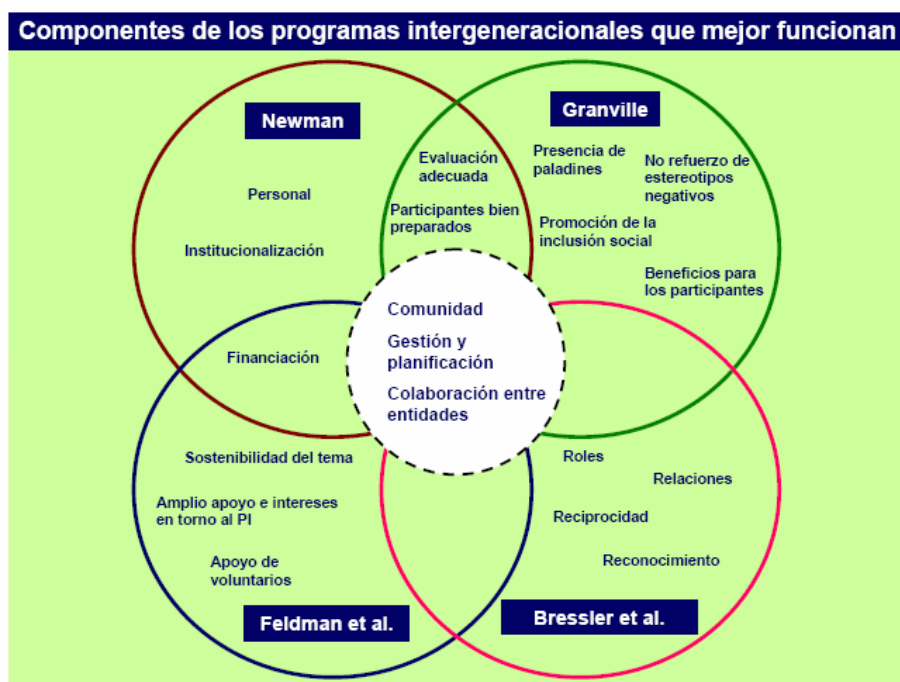
Cuadro 1: Componentes de los programas intergeneracionales que mejor funcionan.