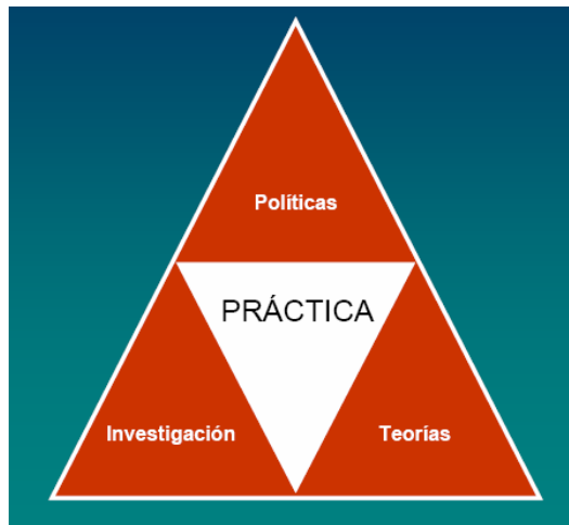
Cuadro 2: Componentes más destacables dentro del campo intergeneracional